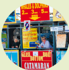
In de havens van het zuiden wachten aanbieders van boottochten op klanten.