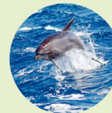
Als je geluk hebt, zie je onderweg dolfijnen boven het water uitspringen.

Waar iets bijzonders is te zien, is de toeristische industrie niet ver weg. Zo waren er op Tenerife veel boten waarvan de exploitanten zich niet zo zeer aan het onderzoek van de dieren wijdden, maar alleen flink aan ze wilden verdienen. En hoe dicht men bij het 'object' wist te komen, hoe groter het plezier. Dit bracht echter veel schade toe aan de geluidsgevoelige dieren. Om de walvissen beter te beschermen, verleent de eilandregering sinds 2008 een vergunning voor 'walvisvriendelijke excursies' – is een dier gespot, dan mag de boot hem tot maximaal 60 m naderen.