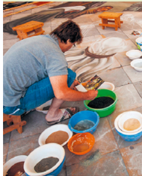
Op Sacramentsdag ( Corpus Christi ) worden de straten en pleinen van La Orotava versierd met kleurrijke tapijten van lavazand. En niet alleen met Bijbelse taferelen ...

Op het terras van Café Grimaldi in het Casa Lercaro 8 serveren ze huisgemaakte taart, tapas en broodjes.