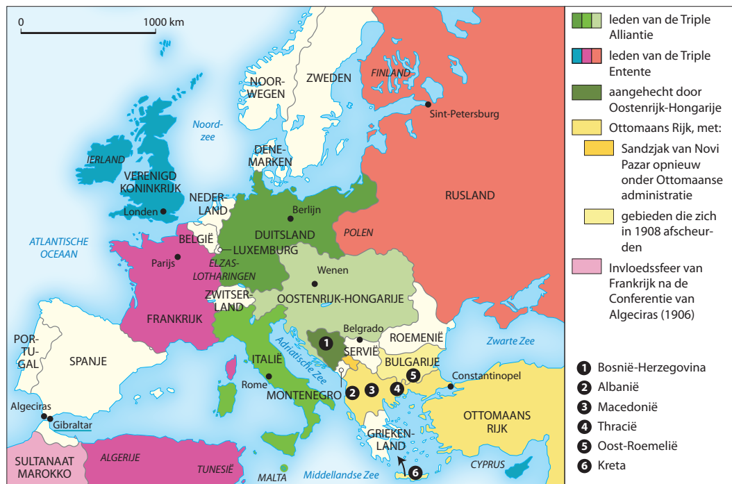
Kaart van Europa in 1908. 46

Niall Ferguson zoekt een antwoord in de politieke geografie. Midden- en Oost-Europa zijn volgens hem het breukvlak waar tektonische aardplaten ongemakkelijk tegen elkaar begonnen te schuiven. Die van het Ottomaanse Rijk begon te wankelen, die van de Oostenrijkers-Hongaren (Habsburgers) en de Russen (Romanovs) drongen vooruit. Ook die van de Duitse Hohenzollern kwam in beweging.