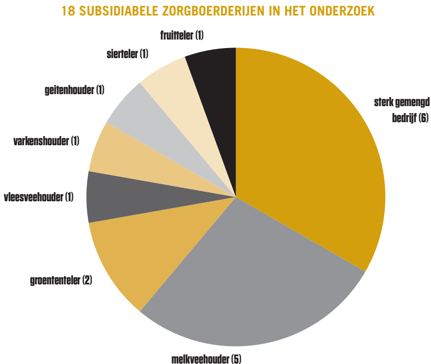
Figuur 1: overzicht van de achttien subsidiabele zorgboerderijen in het onderzoek

Alle landbouwsectoren zijn vertegenwoordigd in de subsidiabele bedrijven in het onderzoek: klassieke landbouwbedrijven (18) voor melkvee (5), vleesvee (1), groenteteelt (2), varkens (1), geiten (1), sierteelt (1), fruitteelt (1) en daarnaast sterk gemengde bedrijven (6) met minstens twee grote takken of meerdere (kleinere) takken (figuur 1). Twee bedrijven werken biologisch. Juridisch gezien zijn twaalf bedrijven een eenmanszaak, drie een landbouwvennootschap, twee een bvba en is één bedrijf een cvba. De bedrijfsoppervlakte varieert van 4 à 6 hectare (groenteteelt, geitenbedrijf) over ongeveer 11 hectare (varkens-, sier- en fruitteelt) tot 40 à 60 hectare (sterk gemengde en melkveebedrijven). Impressie van de schaal van de dierlijke productie (verschillende bedrijven): 70 melkgeiten, 40 à 60 melkkoeien, 50 à 140 vleeskoeien, 500 varkens en 100 zeugen.