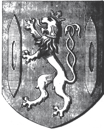
Afbeelding 1. Wapenschild van het Gentse wolweversambacht. Afbeelding afkomstig uit: F. De Potter, Gent, van den oudsten tijd tot heden: geschiedkundige beschrijving der stad , Gent, 1901, VIII, p. 161.

besteed. 29 Daarin wil ik verandering brengen. Mijn hypothese is dat er in de grote steden van het laatmiddeleeuwse Vlaanderen nieuwe sociale verhoudingen binnen de ambachtsgilden (een intern conflict) ontstonden die de traditionele tegenstellingen tussen de stedelijke belangengroepen (een extern conflict) doorkruisten. Beide conflicten stonden in een dialectische relatie met elkaar: ze konden elkaar overlappen maar ook overstijgen. Die hypothese illustreer ik aan de hand van het voorbeeld van de Gentse (wol)wevers die ik prosopografisch analyseerde. 30