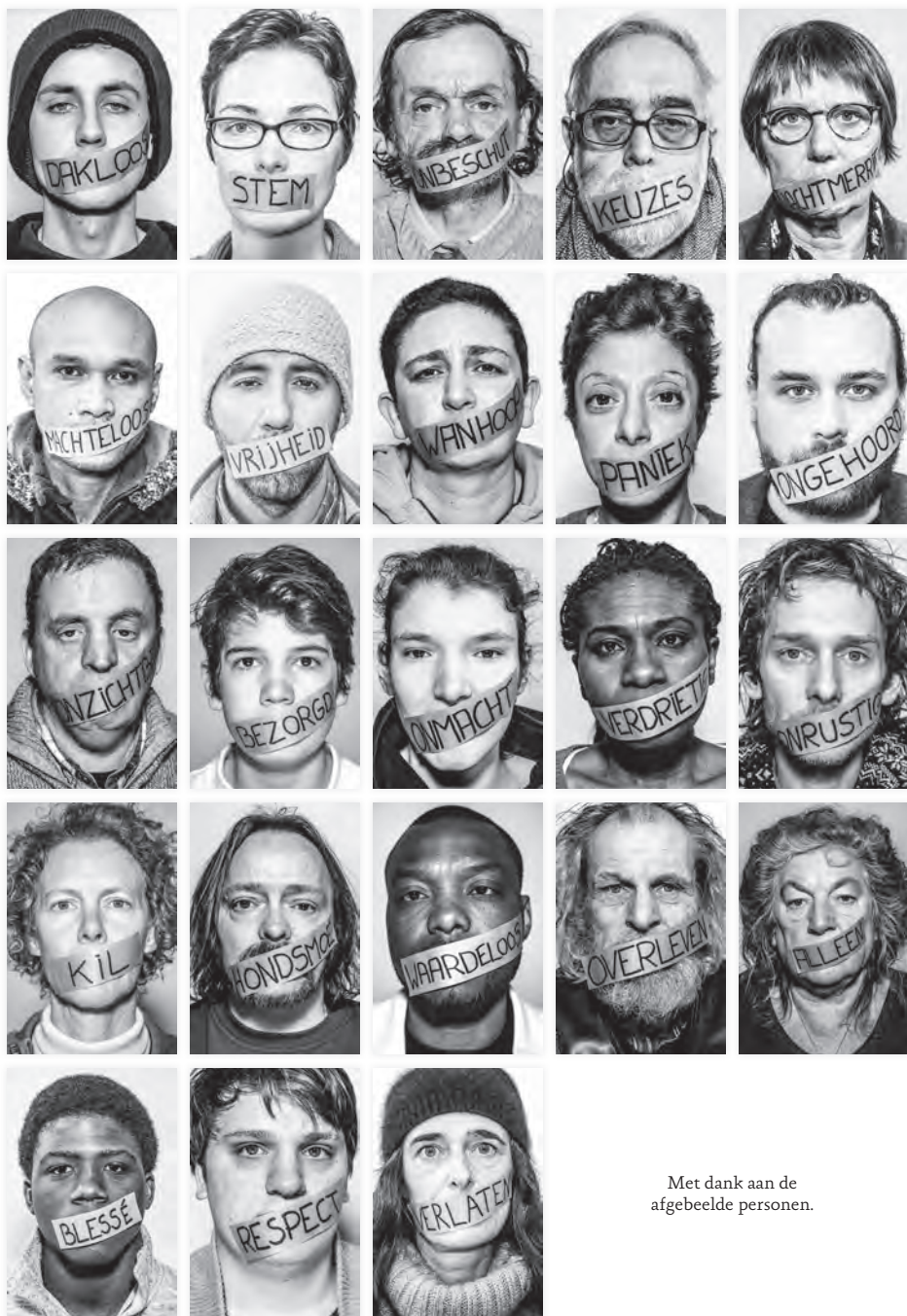
Met dank aan de afgebeelde personen.