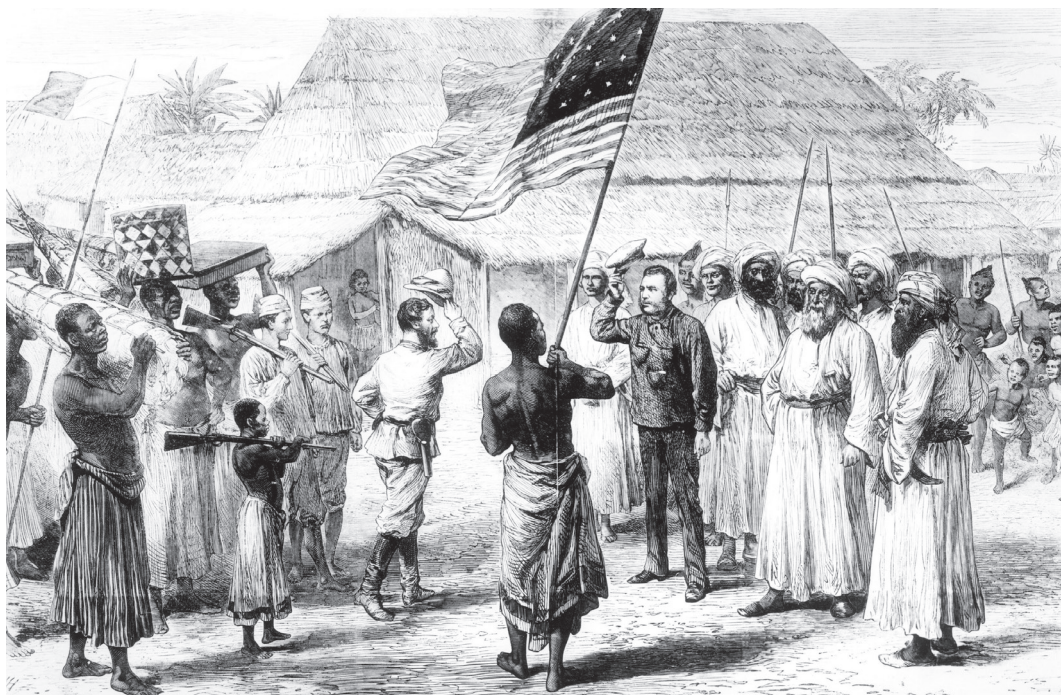
Het leek wel een beetje op de tocht van Stanley en Livingstone...