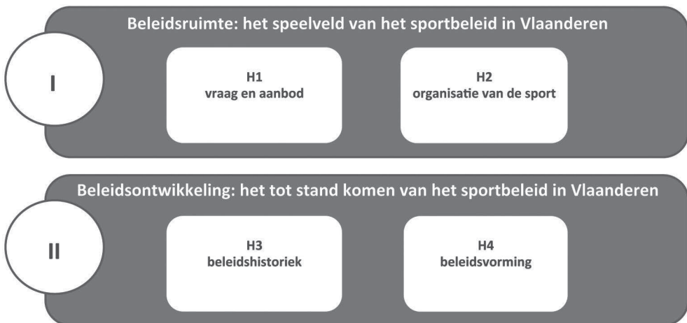
Figuur I.1 Opbouw van het boek Beleid en organisatie van sport

Het voorliggende werk is opgebouwd uit twee delen (zie Figuur I.1). In het eerste deel staat de beleidsruimte van het Vlaamse sportbeleid centraal. Meer bepaald gaan we na hoe het speelveld van het sportbeleid in Vlaanderen eruit ziet. Voorerst staan we stil bij vraag en aanbod in het Vlaamse sportlandschap, geven we